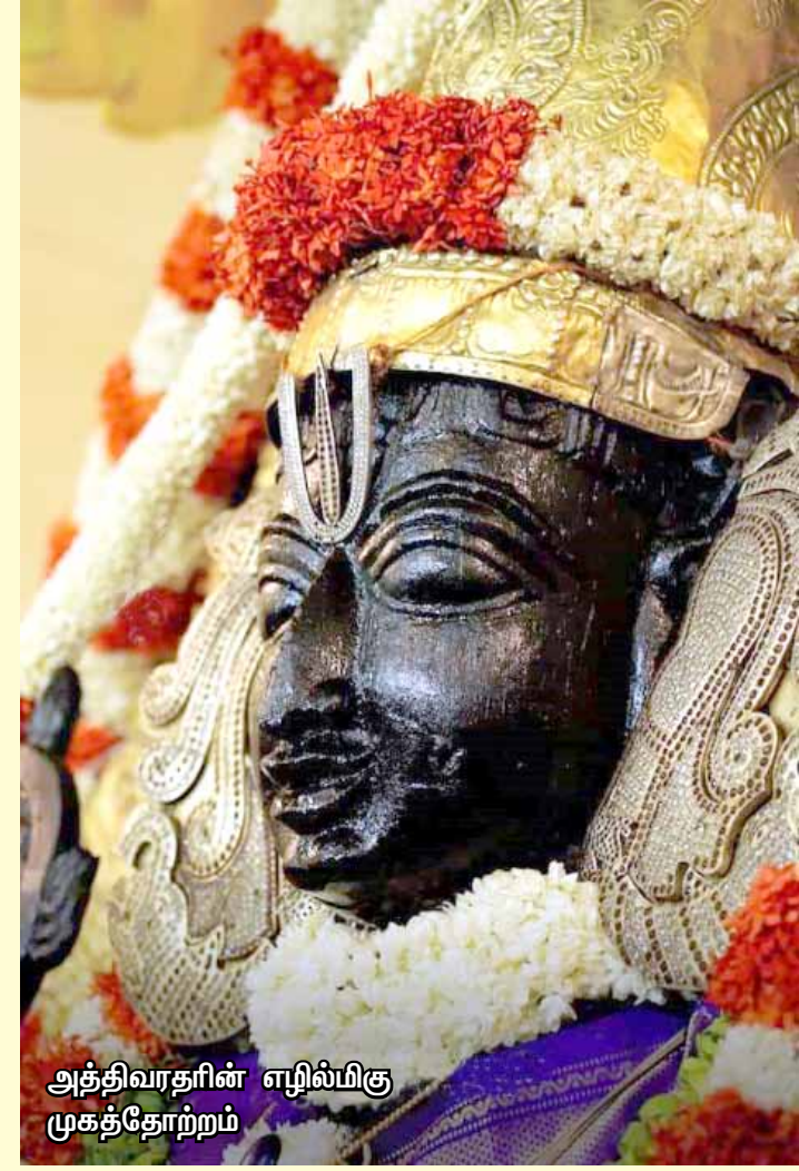
அத்திவரதரின் எழில்மிகு முகத்தோற்றம்

அத்திவரதர் எழுந்தருளியிருக்கும் நாட்களில் அஸ்தம், திருவோணம், ரோகிணி நட்சத் திரக்காரர்கள், உங்கள் நட்சத்திரம் எப்பொழுது வருகிறதோ அதற்கு ஏற்ப வழிபாடு செய்வது