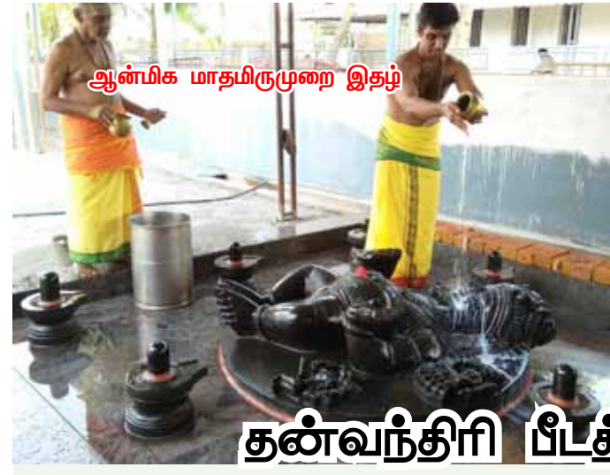
ஆன்மிக மாதமிருமுறை இதழ்